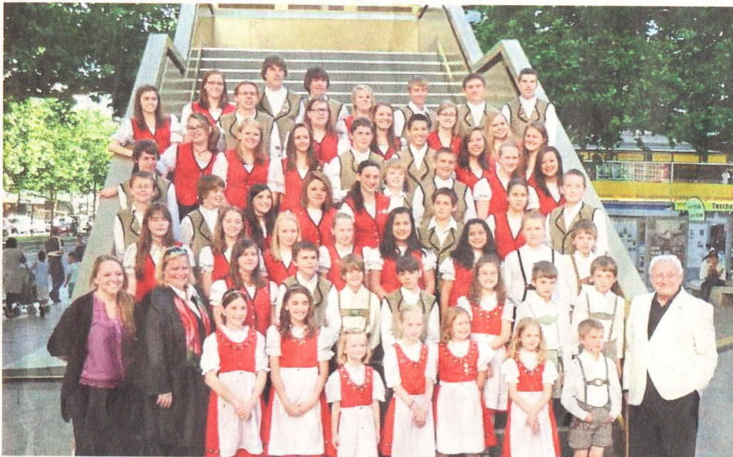
Der Deutsch-Amerikanische Chor aus Chicago gestaltet gemeinsam mit Musikern des Tölzer Gabriel-von-Seidl-Gymnasiums ein Konzert im Kurhaus.

am Dienstag, 5. Juli, beginnt um 19.30 Uhr (Einlass 18.30 Uhr); der Eintritt kostet 15 Euro (Abendkasse) und 12 Euro im Vorverkauf. Karten gibt es ab sofort bei der Tourist-Info oder im Sekretariat des Gymnasiums.